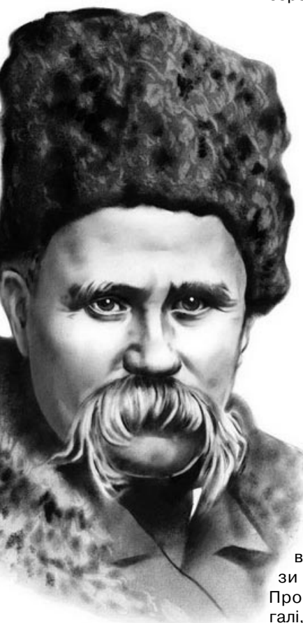
Тарас Шевченко (1814—1861)

Заступник директора з виховної роботи Дворічанського ліцею.